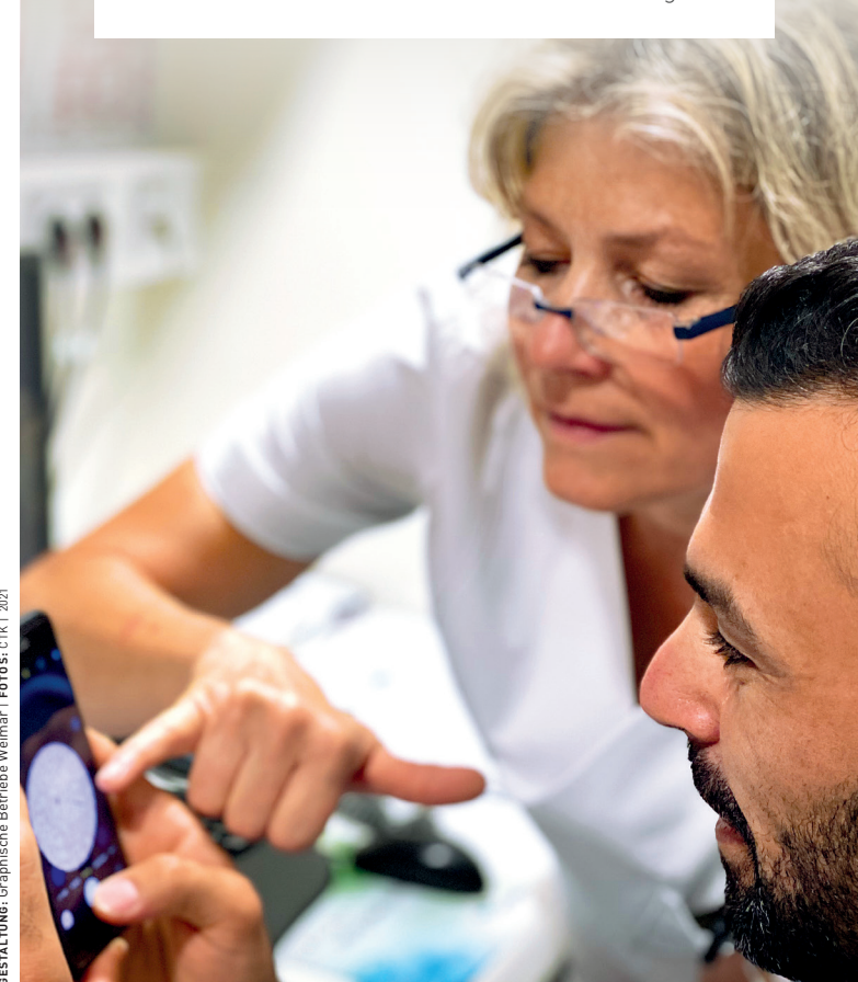
GESTALTUNG: Graphische Betriebe Weimar | FOTOS: ctk | 2021

zum/zur Praxisanleiter*in (berufsbegleitend)